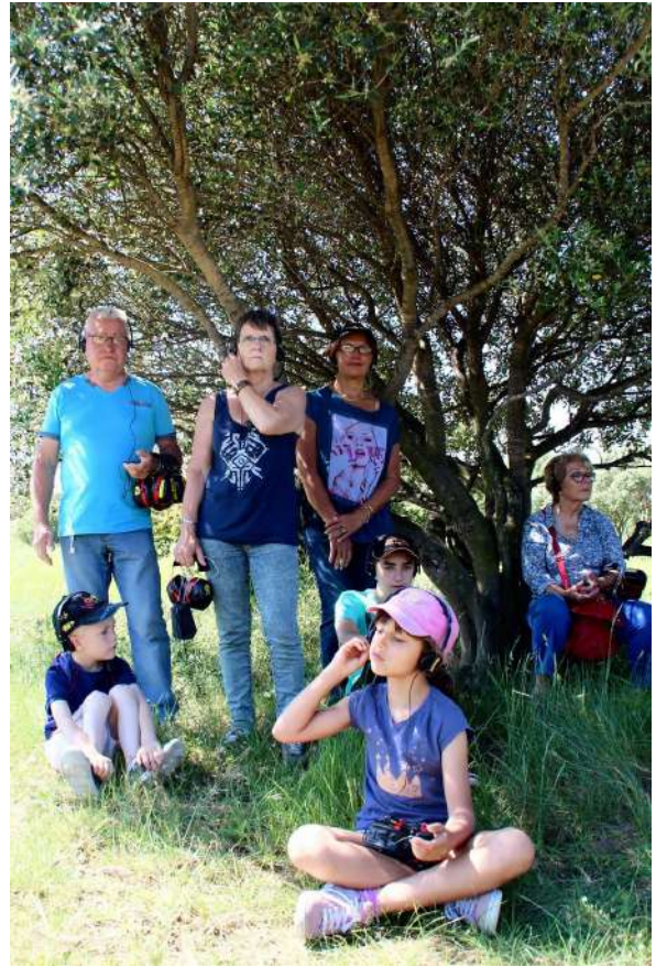
Marches d'écoutes « Les Marches Inouïes »