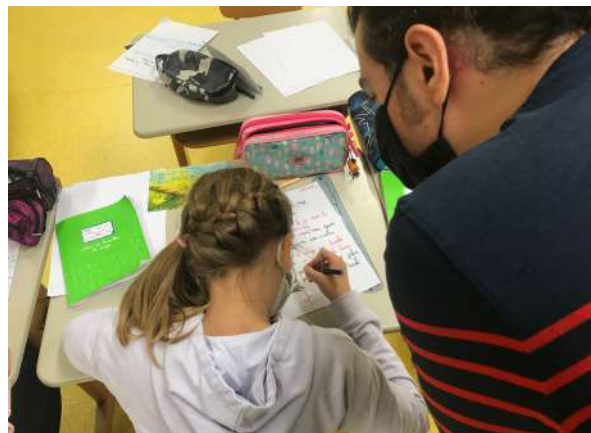
Atelier d'écriture à l'école d'Anglefort