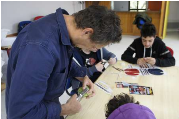
Atelier Cyril Hatt Centre socioculturel ALCC 73