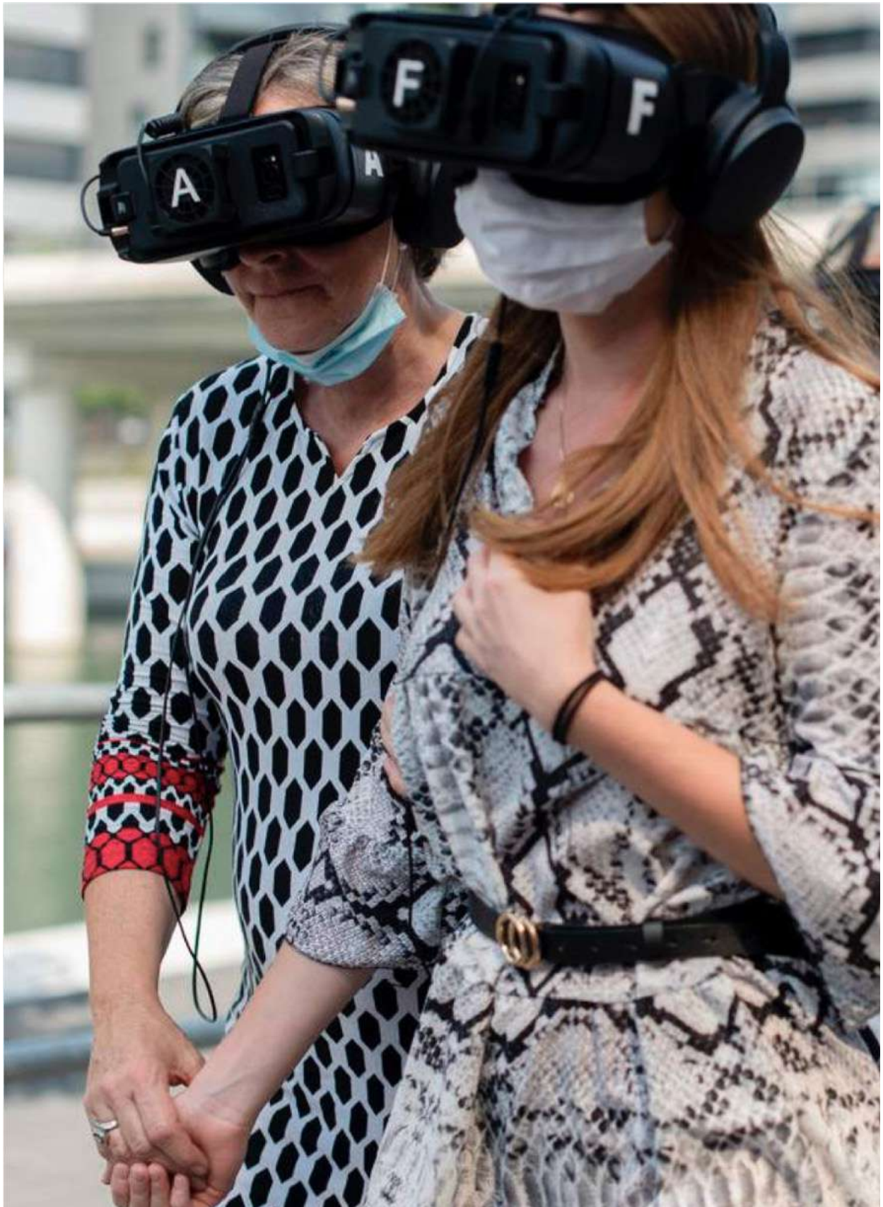
BIG TORRENT LYON Confluence Juillet 2020