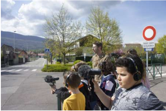
Atelier d'écoute et de découverte du filed recording. École Jules Coissard Seyssel (74)