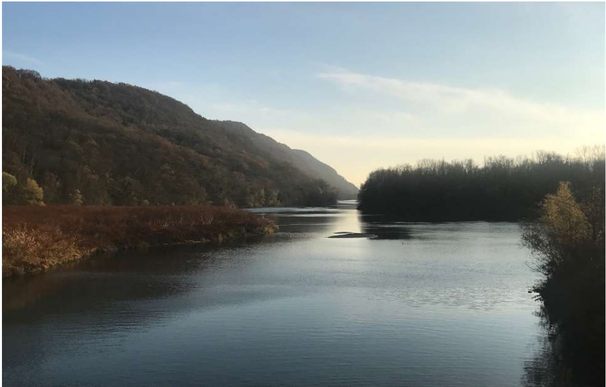
Le Rhône naturel à Chanaz

CODE SOURCE est un appel à mieux connaître le fleuve pour mieux cohabiter avec lui. A travers la création d'œuvres contemporaines originales et participatives, un dialogue entre le Rhône et la population est alors ouvert.