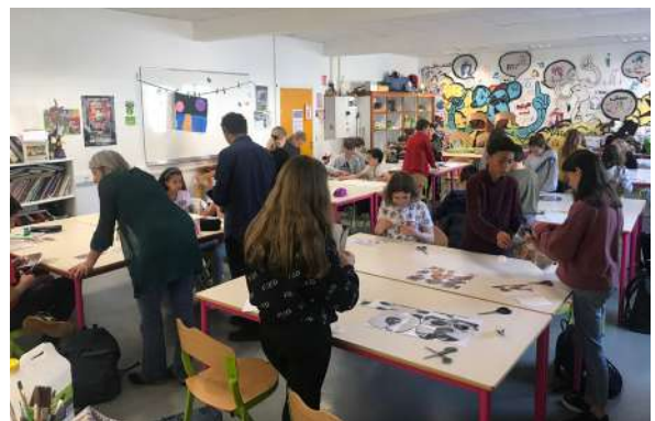
Atelier Cyril Hatt Collège du Mont des Princes Seysssel (74)