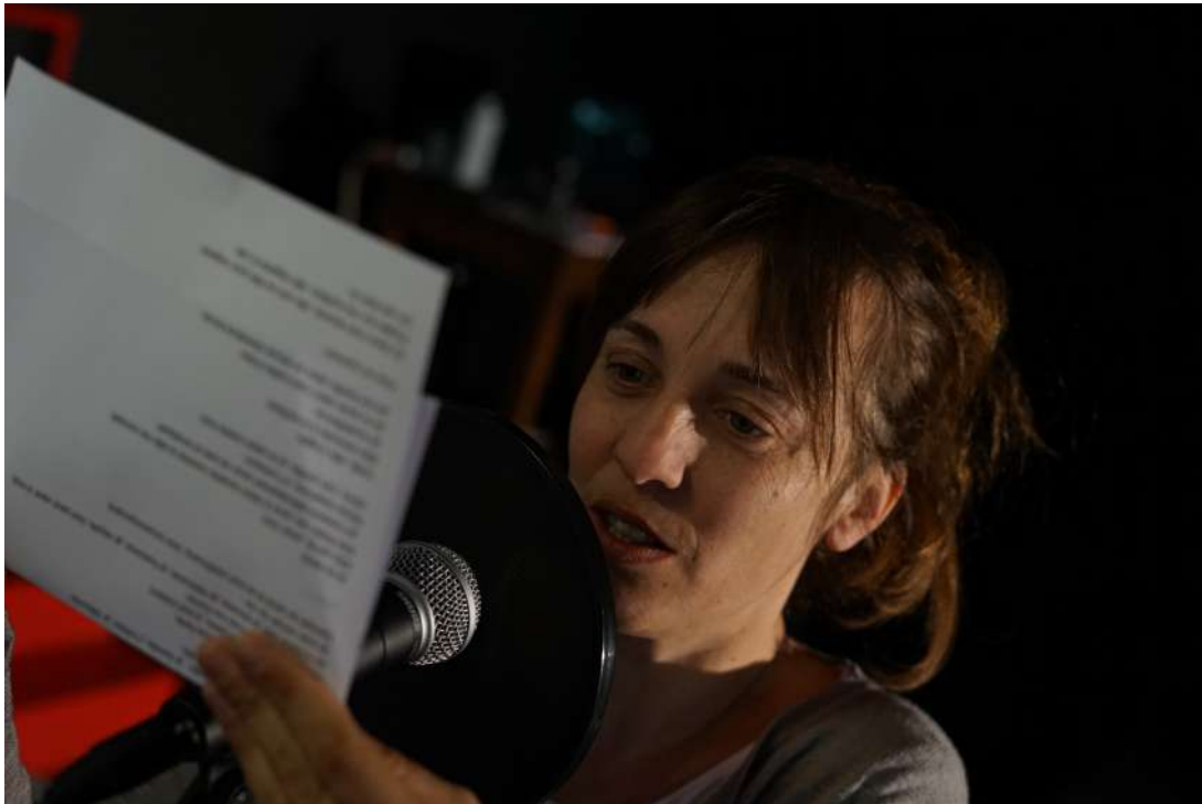
Enregistrement de textes à Ruffieux - Chautagne