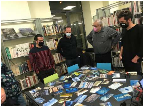
Atelier d'écriture à Valsershône