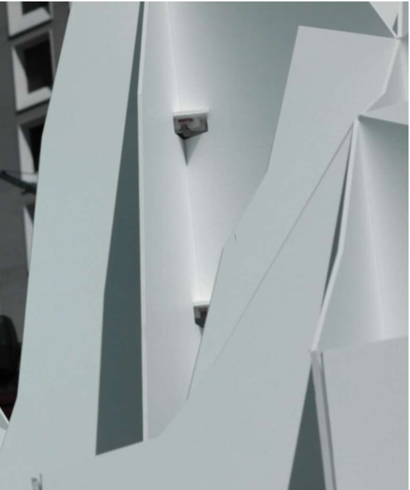
BIG TORRENT - LYON 2020 La Texture de La Houle Lyon, Vincent Mauger ©Damien Oliveres