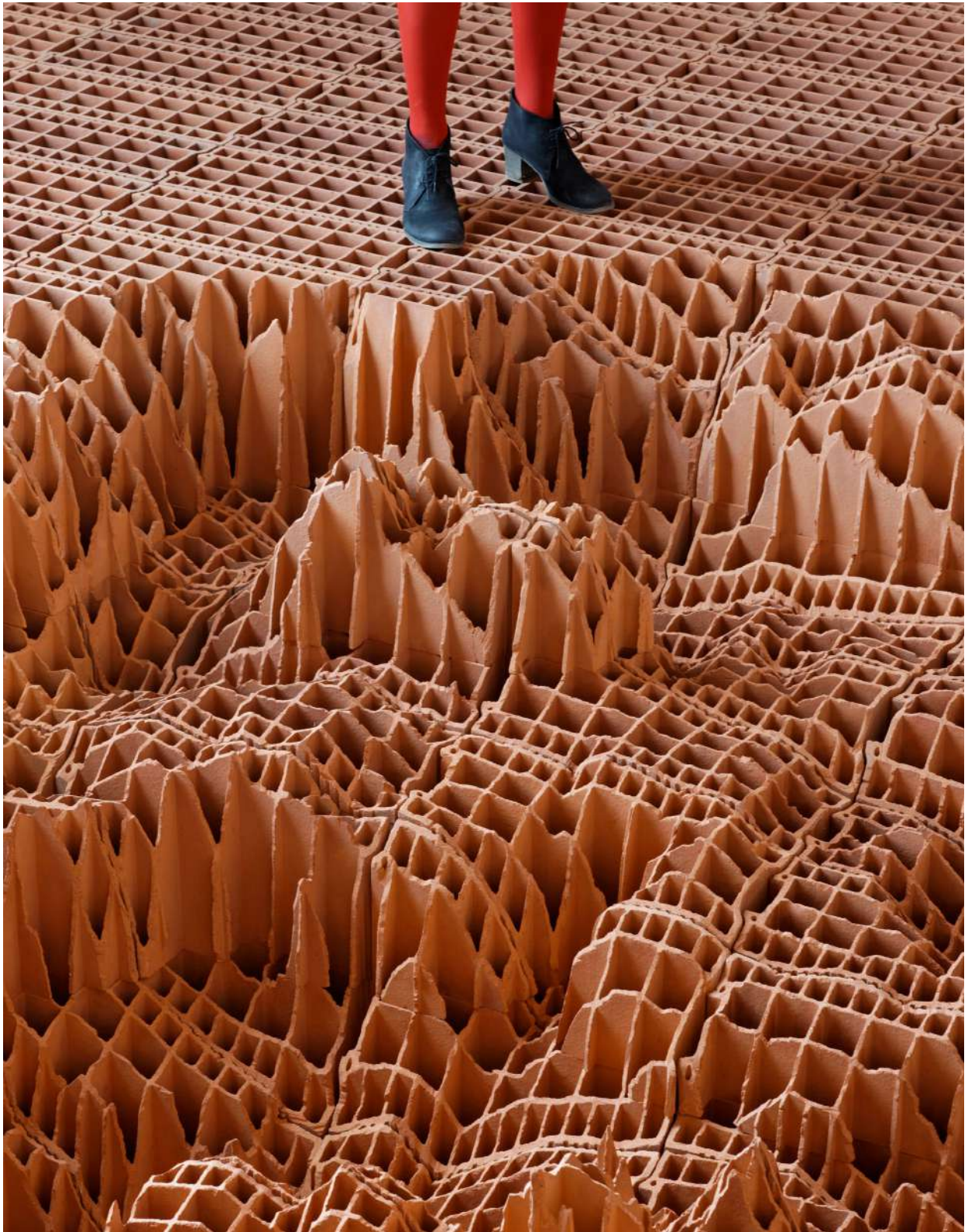
Super Asymmetry - Vincent Mauger ©Bipolar