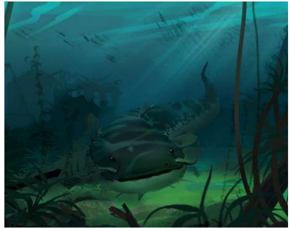
LE TEMPS DU MONSTRE (prototype) - Benjamin Nuel ©Atlas