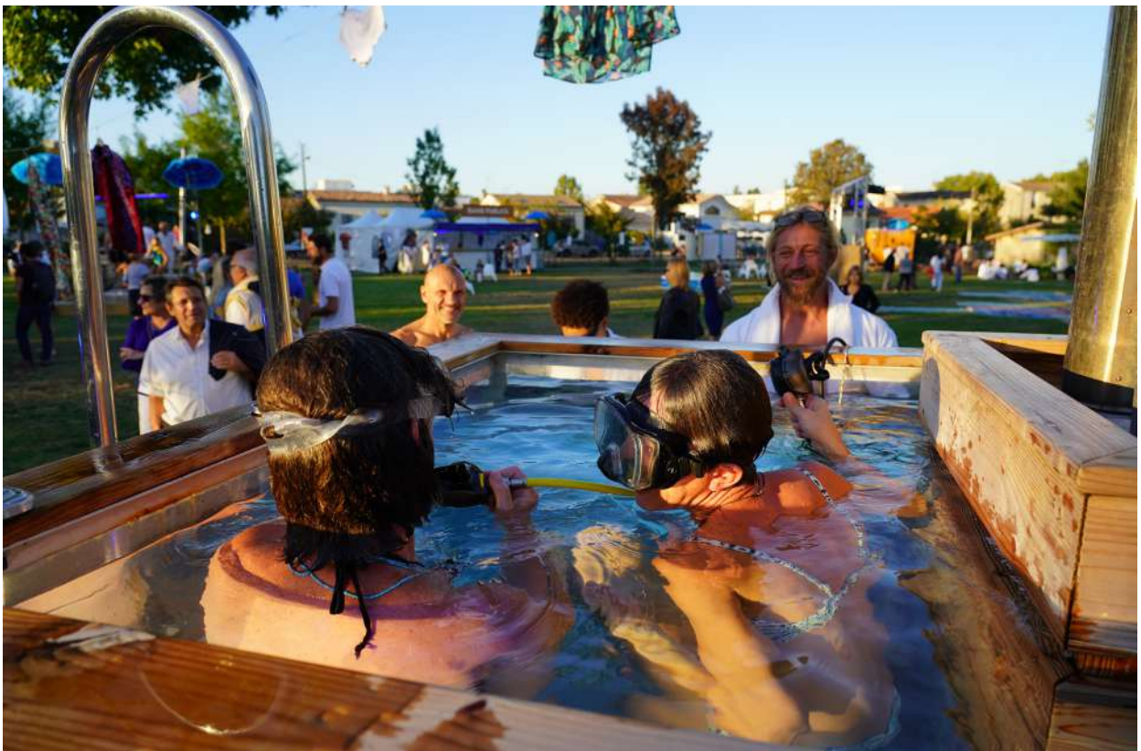
Bains publics- 3615 Dakota