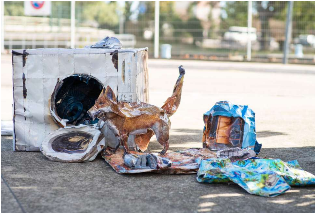
BIGTORRENT - Les Résurgents Cyril Hatt Octobre numérique Arles 2019